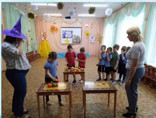
Игра «Полезные и вредные продукты»