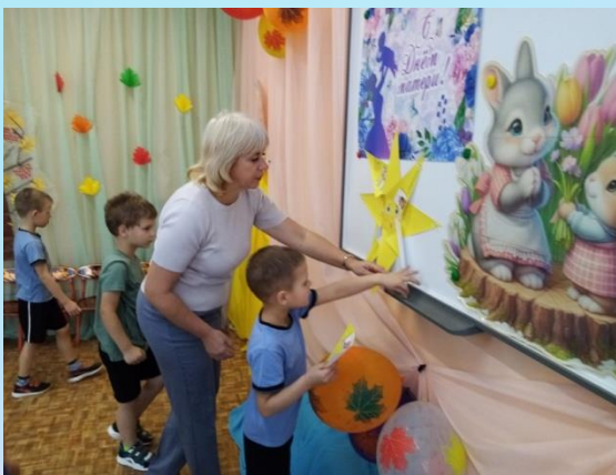
Фото отчет к логопедическому занятию с применением нейроигр